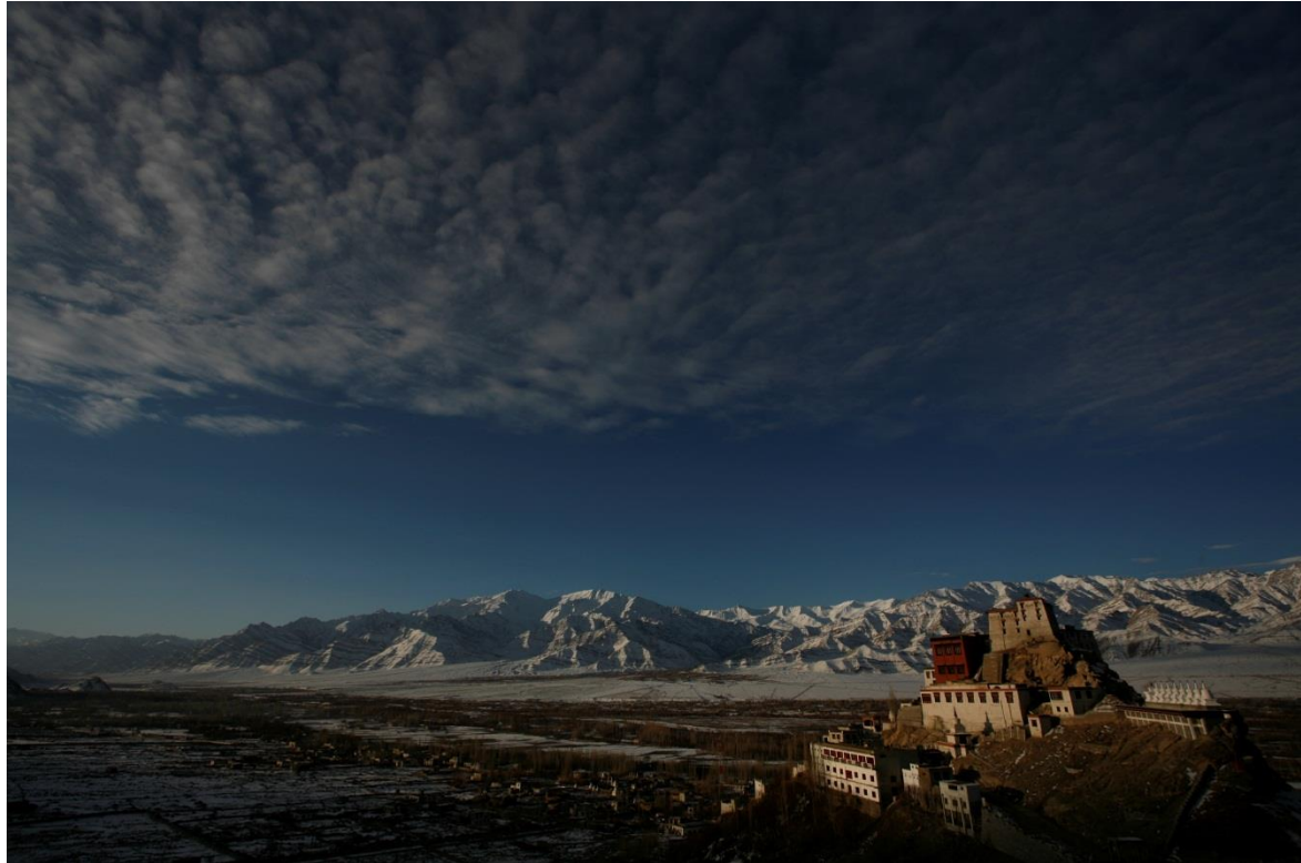
Sonnenaufgang am Kloster Tikse (10km von Leh)